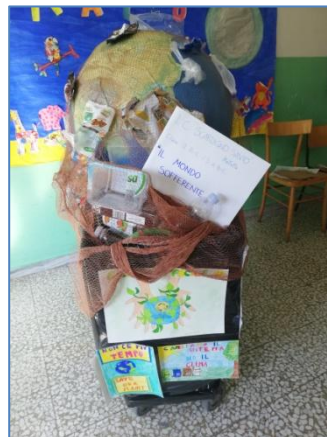
Classi Seconde B – C e Terze A - B – C Scuola “R. Scardigno”