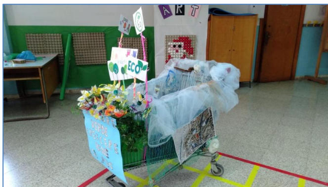
Classi Quarte A - B e Quinte A - B – C Scuola “R. Scardigno”