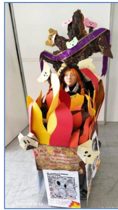
Classi Terze D – E e Quinta D Scuola “V. Valente”